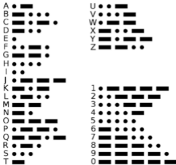
Abbildung 1: Morsealphabet